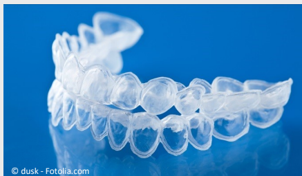
Bleaching-Form aus Kunststoff, in die Sie das Aufhellungs-Gel einfüllen.

Beim Home-Bleaching werden vom Zahnarzt dünne flexible Formen aus einem transparenten Kunststoff hergestellt, die genau auf Ihre Zähne passen (siehe Foto).