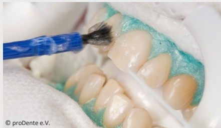
Power-Bleaching beim Zahnarzt: Auftragen des Bleaching-Gels

Wenn Sie die Praxis wieder verlassen, können Sie sich an sichtbar helleren Zähnen freuen!