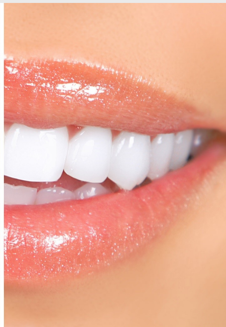
Deutlicher Unterschied: Professionelles Bleaching beim Zahnarzt wirkt!