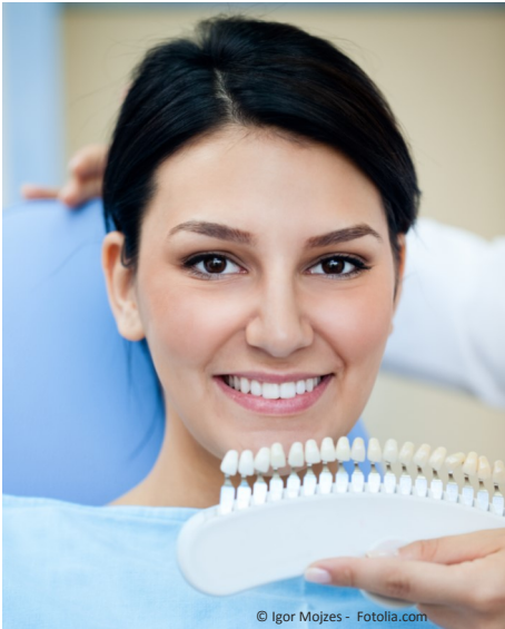
Bleaching vom Zahnarzt: Gewinnendes Lächeln mit strahlend weißen Zähnen

Professionelle Zahnaufhellung durch den Zahnarzt